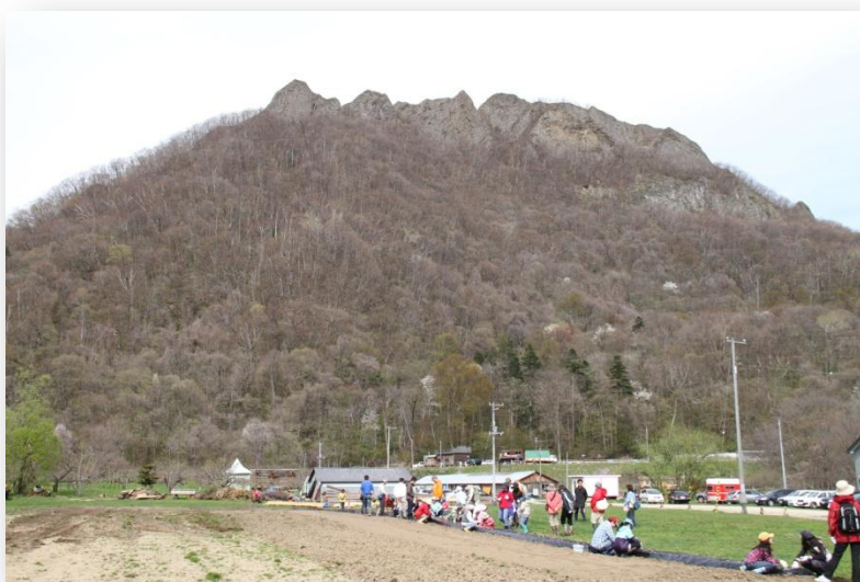
砦山農業小学校・じゃがいもの植え付け

この協働シンポをもって、同プロジェクトは実質的にスタートしました。参加者は、豊かな可能性のある八剣山地域のこの壮大、かつ魅力的な事業のスタートに、大きな期待でもって共感し、それぞれの立場で協力していくことを確認しながら、この日のシンポを終えました。(文責・丸谷)