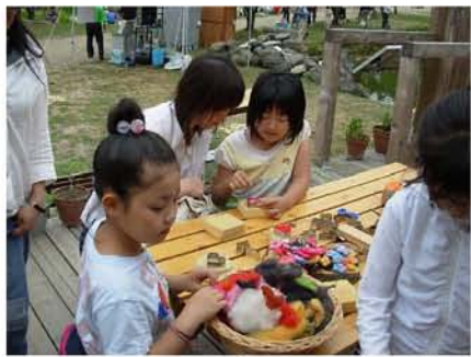
【 羊の毛によるフェルト体験 】