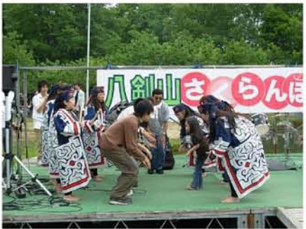
【 アイヌの皆さんによる踊りの指導 】