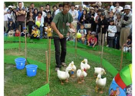
【 アヒル競走と応援する観衆 】