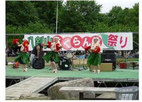
【 ハワイアンダンスステージ 】