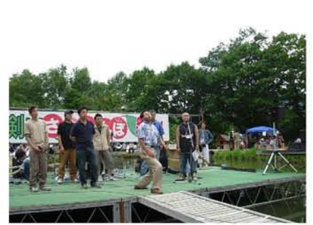
【 さくらんぼの種飛ばし 】