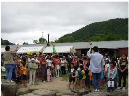
【 ○×農業クイズ 】