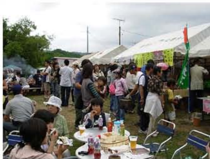
【 売店の前のにぎわい 】