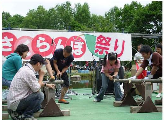
【丸太切り 少年の部決勝】

八剣山周辺の農家の皆さんは、それぞれの農園が独自の取り組みを行い、皆さんが楽しめる工夫に挑戦しています。今後とも、皆さんのおいでをお待ちしております。