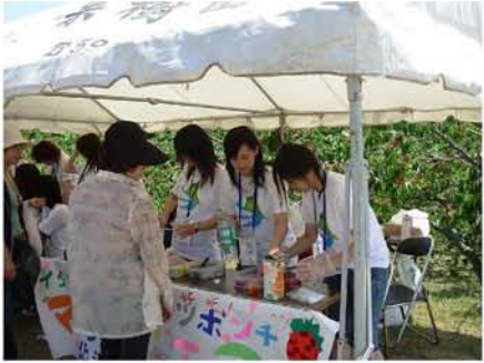
【 学生による販売ブース 】