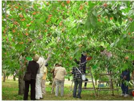
【 にぎわうさくらんぼ狩り 】