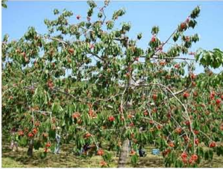
【 たわわに実ったさくらんぼ 】