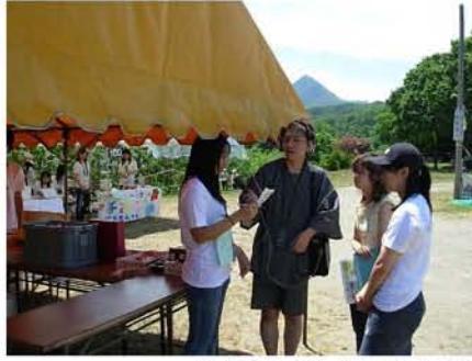
【 FMラジオによる実況放送と取材を受ける学生たち 】