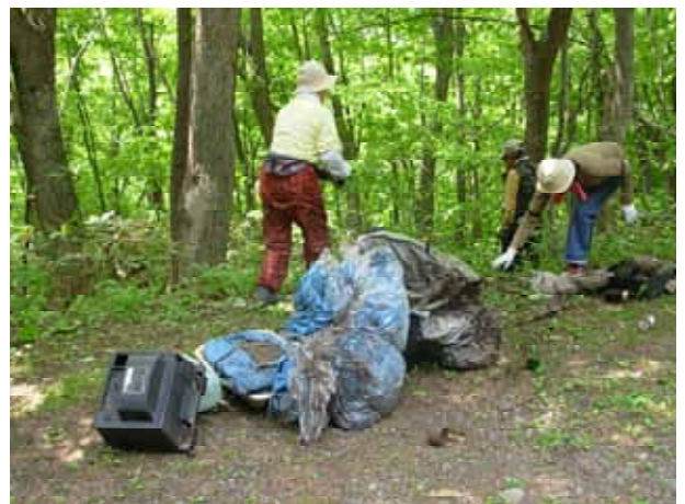
【 八剣山の南側登山口周辺で収集したゴミの山 】