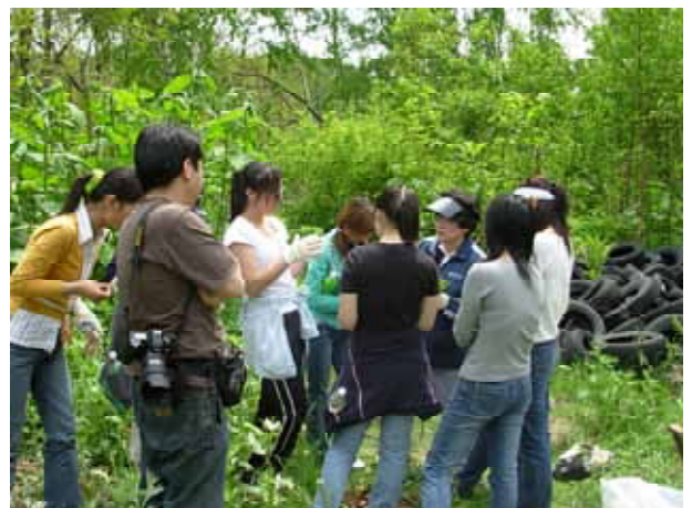
【 ゴミ収集の合間に実施した山菜説明会 】