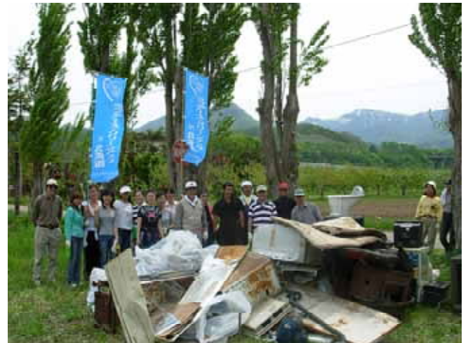
【集められたゴミの山と参加者】

今回は、北海商科大学に中国から留学中の8名の学生さんも、八剣山周辺の美化活動のために参加してくれました。