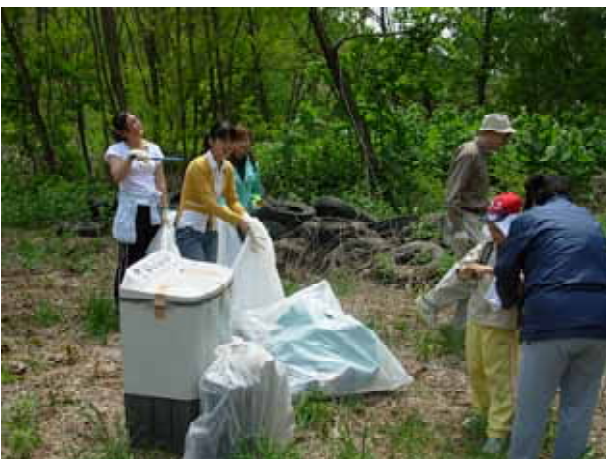
【 昨年度と同じ場所で新たに収集されたゴミ 】