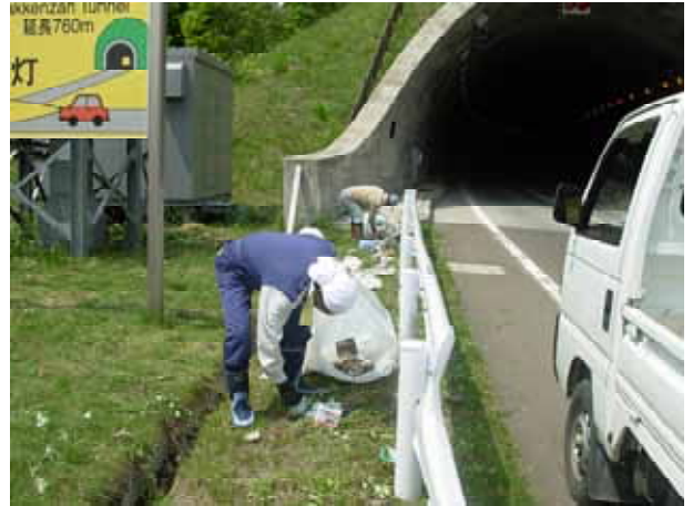
【 トンネルの前でのゴミの収集 】