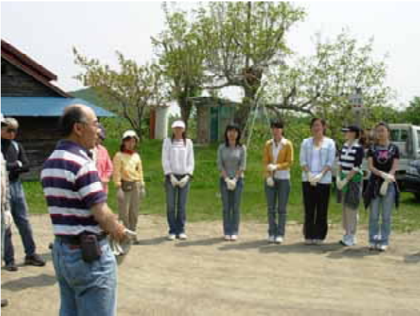
【 開始に当たっての事前説明 】