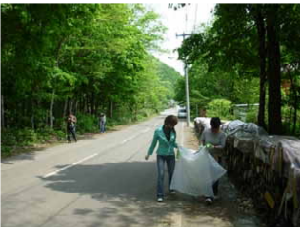
【 道路沿線を歩きながらのゴミ収集 】