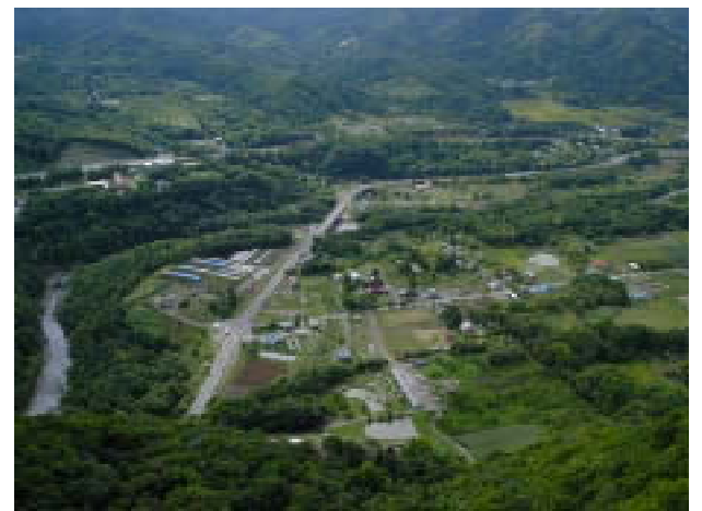
【八剣山山頂からの眺望】