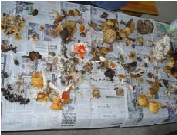
【収穫されたキノコ類】