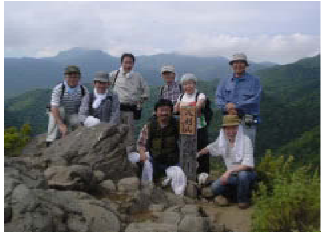
【八剣山の山頂にて】

八剣山のシルエットがうっすらと浮かび上がり、月の光が照らし、火星が光り輝く中で、会場の4カ所がかがり火が焚かれるなど、宇宙を含む大自然の中での幻想的な、すばらしいコンサートとなりました。