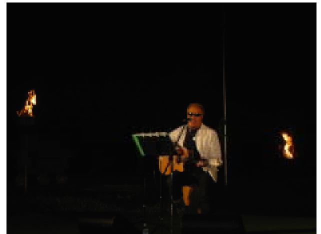
【みのや雅彦コンサート】