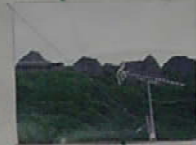
いい登ると岩肌が目立つ。