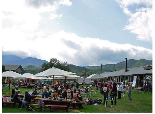
【 晴れわたった会場の賑わい 】