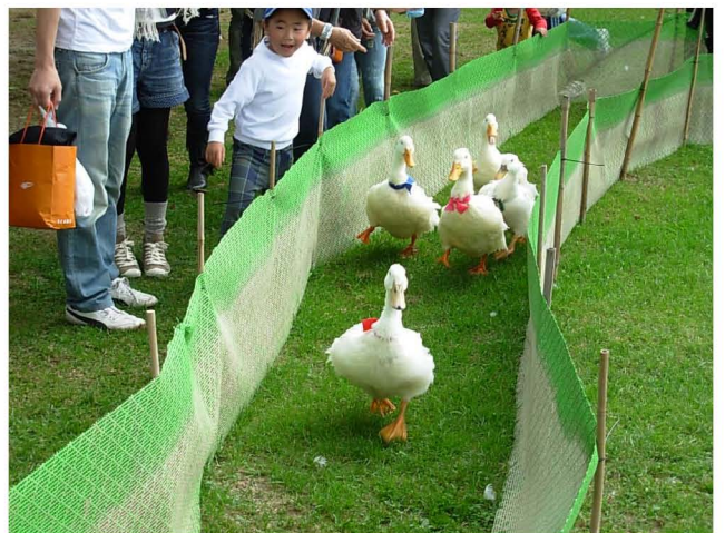
【 レースで独走する赤リボンのアヒル 】