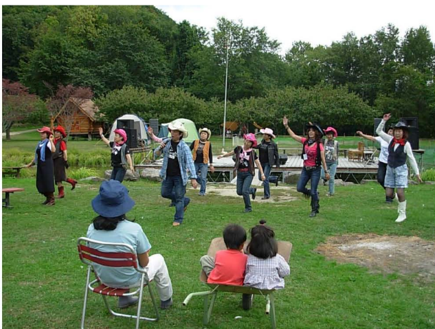
【 ウェスタンダンスと一輪車の観衆たち 】