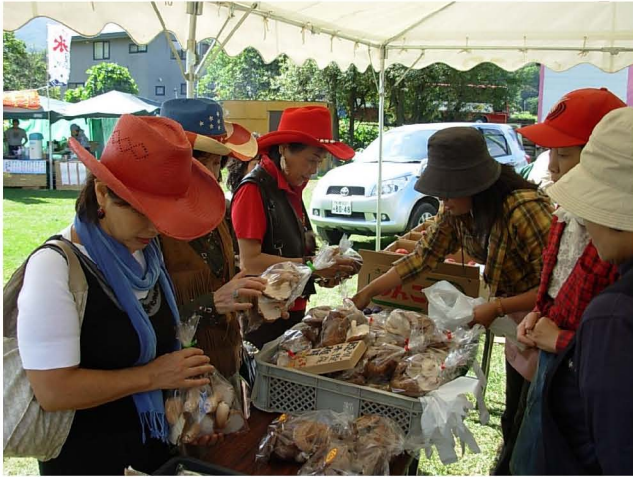
【 直売所で野菜や果物を購入する皆さん 】