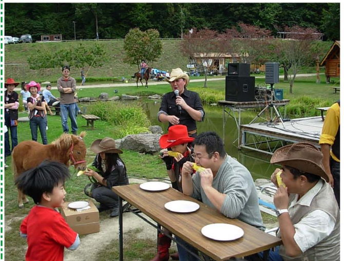
【ポニーとのトウモロコシの早食い競走】

八剣山発見隊では、会場における野菜や果物の直売を担当しましたが、準備をしている段階から野菜や果物を買いたい来場者が押しかけて忙しい時間もありましたが、それほど人でごった返すこともなく、すがすがしい一日を八剣山のふもとで、楽しく過ごすことができました。