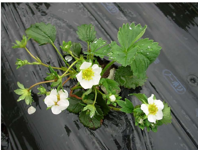
【咲きはじめてイチゴの花】