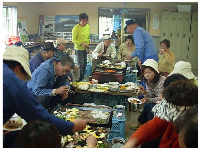
【小屋の中で交流を深める会員】

花見会は、半割りのドラム缶に炭火をおこして網をのせ、ジンギスカンのほかホッケやイカ、ジャガイモやタマネギなどの野菜、差し入れされたウドを焼いて、みんなで箸をつつきながら、交流を深めたところです。