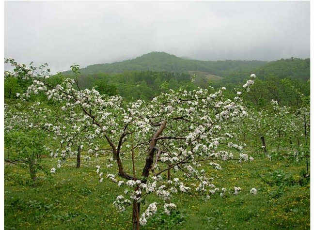
【恵みの雨に濡れる果樹園】