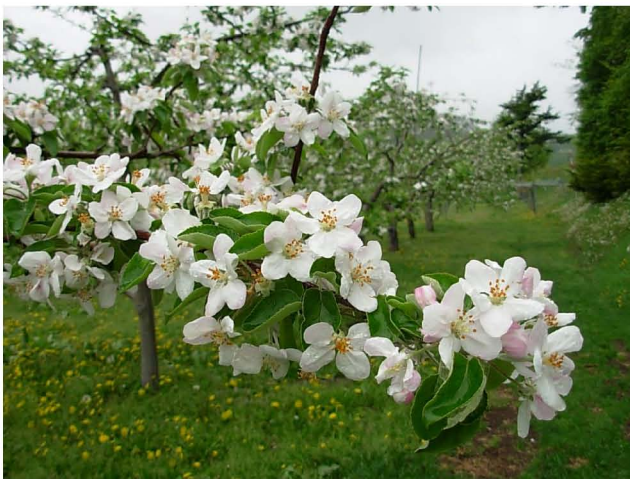
【満開のリンゴの花】