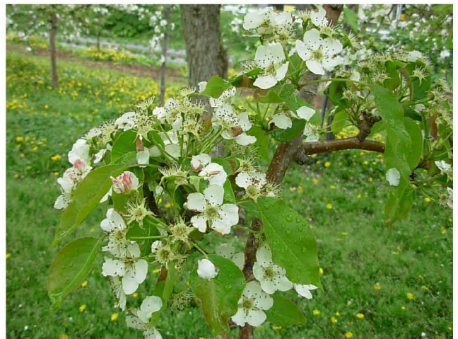
【満開を過ぎたナシの花】