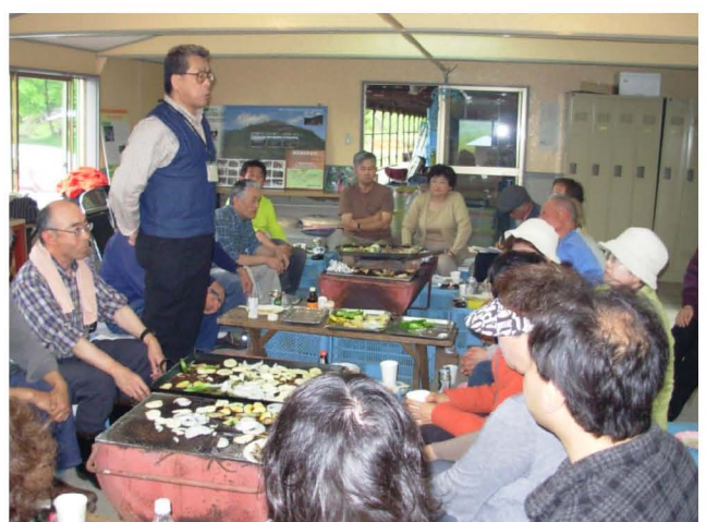
【交流会における各自の近況報告】