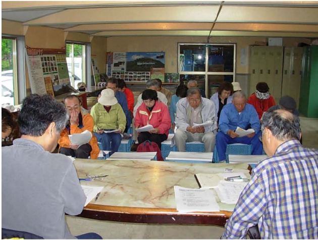
【平成21年度通常総会の審議】