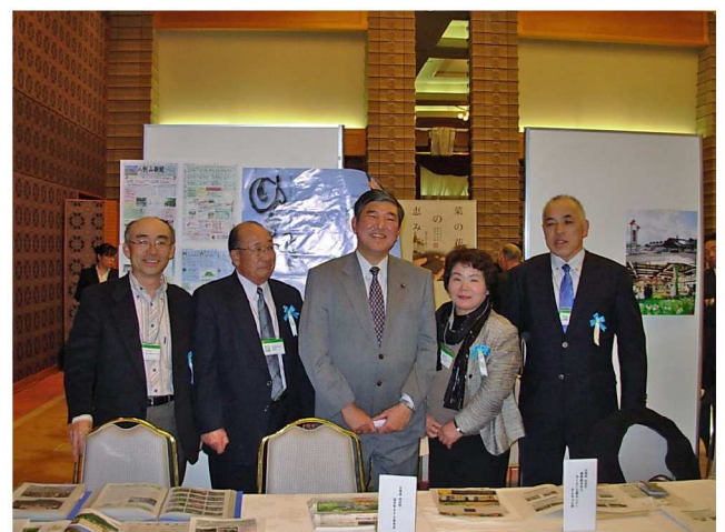
【 石破大臣と北海道東北地区の受賞者 】