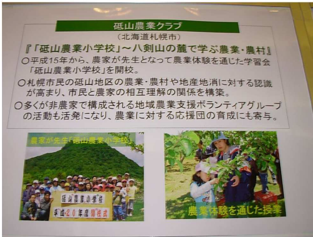
【 砥山農業クラブの紹介パネル 】