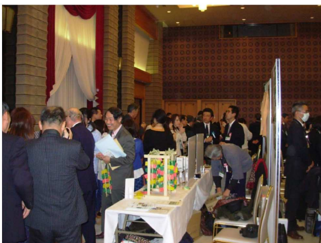
【 交流会会場の様子 】