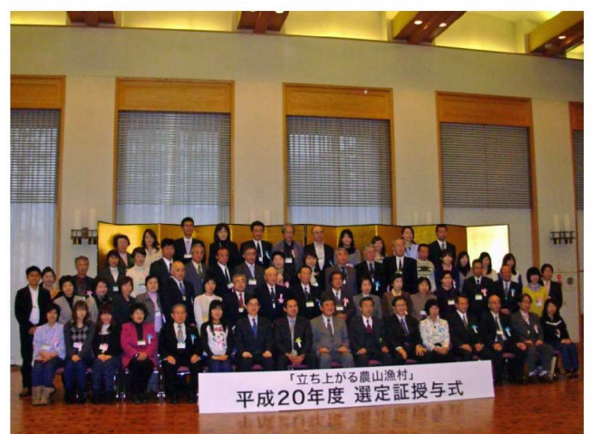
【 授与された皆さんとの記念撮影 】