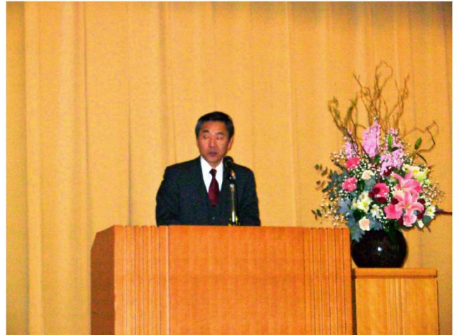
【 林座長の挨拶と講評 】