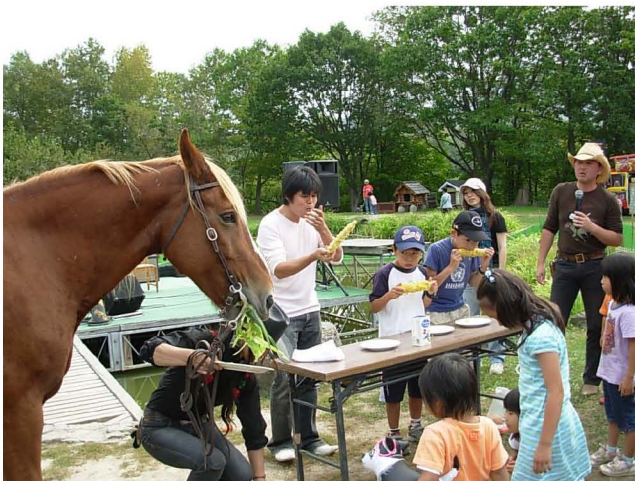
【 トウモロコシの早食い競走 】