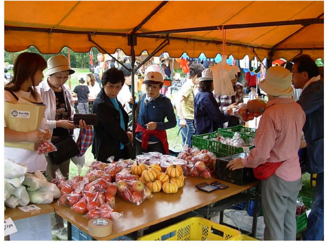
【 農産物直売ブースのにぎわい 】