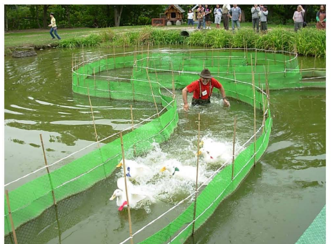
【 必死に泳ぐアヒルたち 】