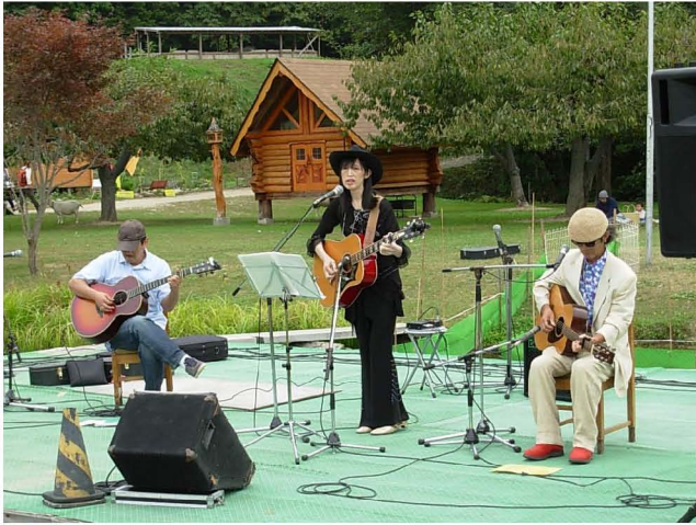
【 カントリーソングの歌と演奏 】