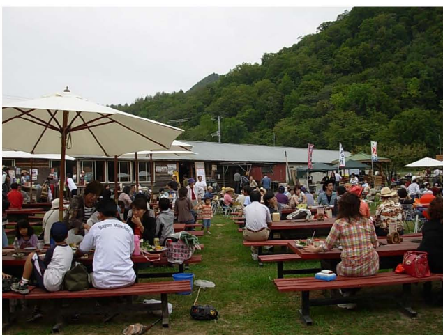
【 会場のにぎわい 】