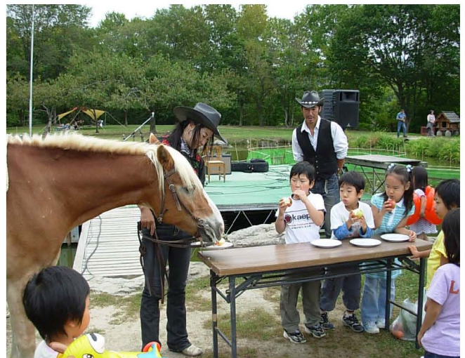
【馬とのりんごの早食い競走】

八剣山発見隊も、アヒルレースの受付や農産物の直売を担当しましたが、集まりすぎてかなり残ると思われた農産物も、販売終了時までには、コーナーの後ろに空箱が積み上がるほど、順調に売れていきました。