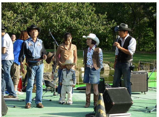
【 ベストドレッサー賞受賞者たち 】