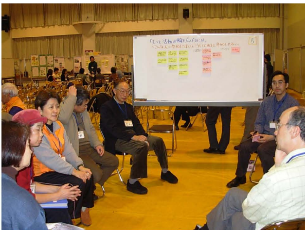
【 車座による団体の意見交換会 】