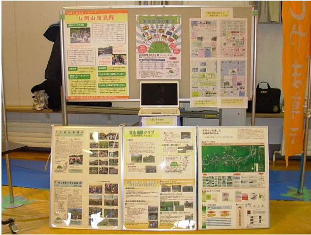
【 八剣山発見隊のコーナー 】