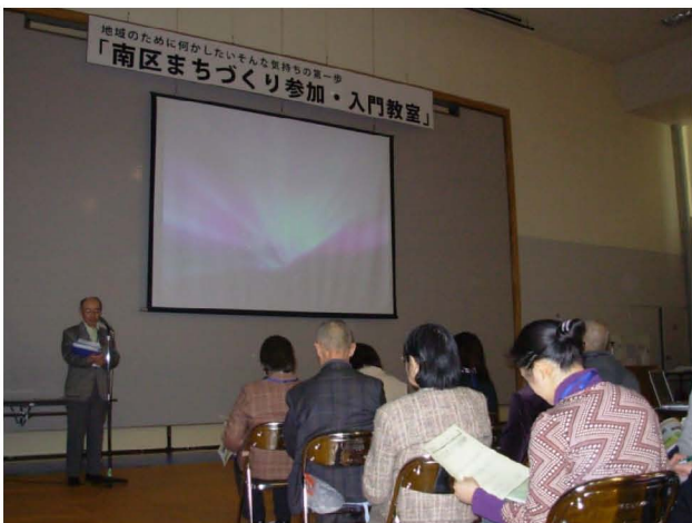
【 八剣山発見隊の紹介 】