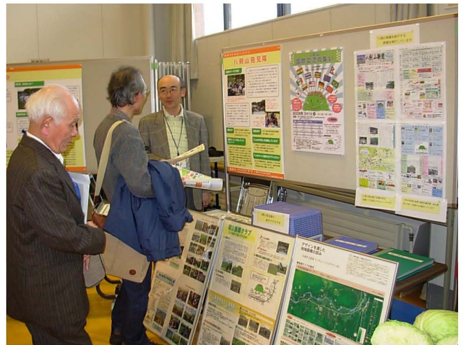
【八剣山発見隊のコーナーでの説明】

また、意見交換会では、3団体と車座になって情報交換を行いました。それぞれの団体との相互交流について、たいへん良いきっかけができたと思います。