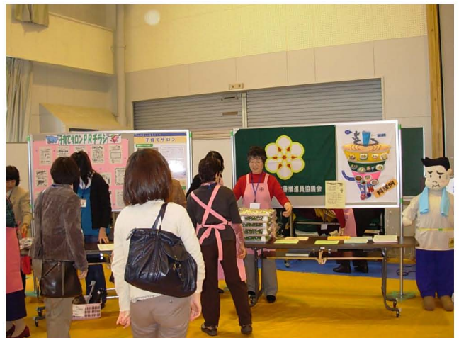
【 パネルなどによる団体の活動紹介 】