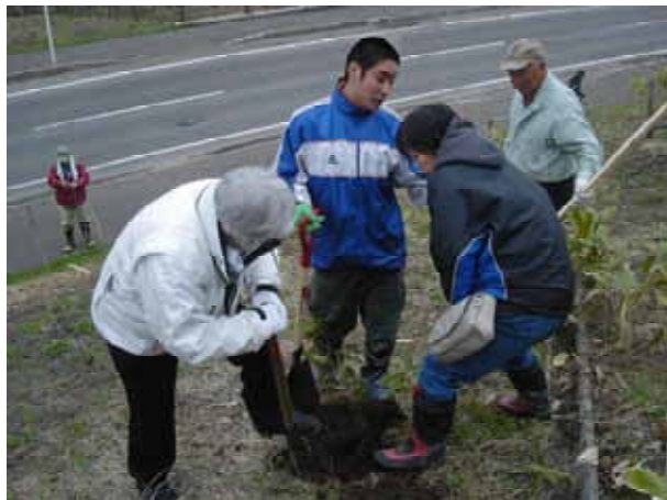
【 見晴らしのいい丘での植樹風景 】