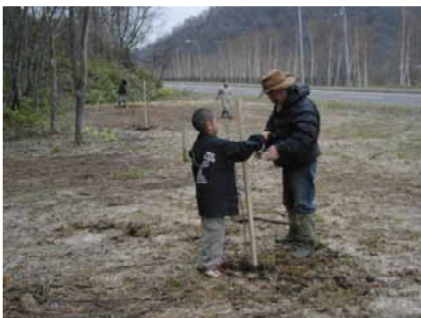
【 おじいちゃんと一緒にの植樹 】