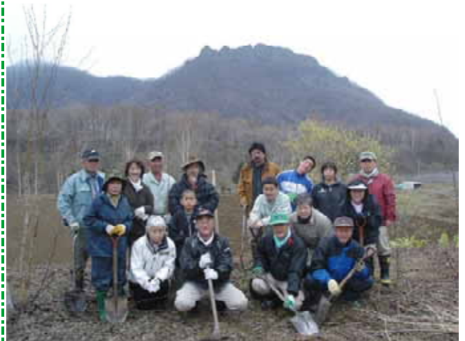
【八剣山をバックに桜の苗木植樹後の記念撮影】

午後からは、八剣山発見隊の平成17年度総会を開催し、16年度の事業報告、17年度の事業計画が承認されるとともに、規約の改正についても一部修正の上で承認されたところです。