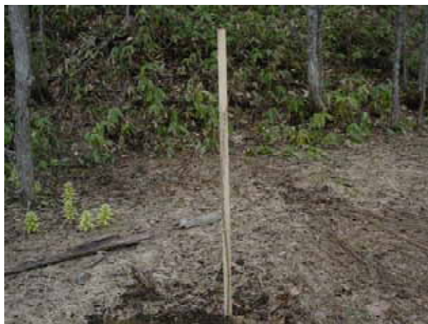
【 植樹された桜の苗木 】