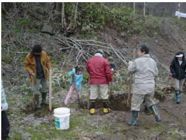
【 参加者全員による苗木の仮植え 】