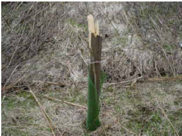
【 大雪の被害により上部が折れた桜の苗木 】