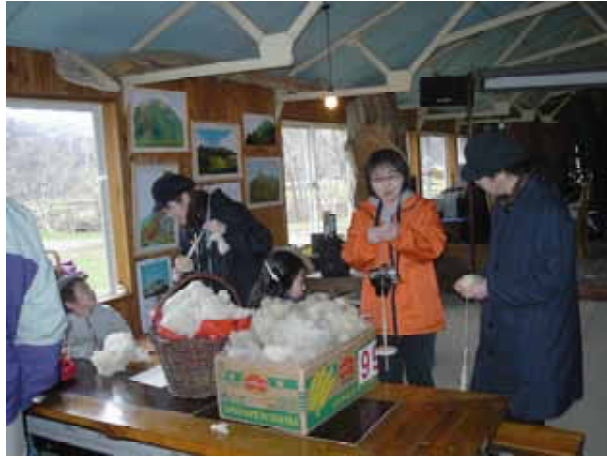
【 八剣山果樹園での羊の毛による系紡ぎ 】