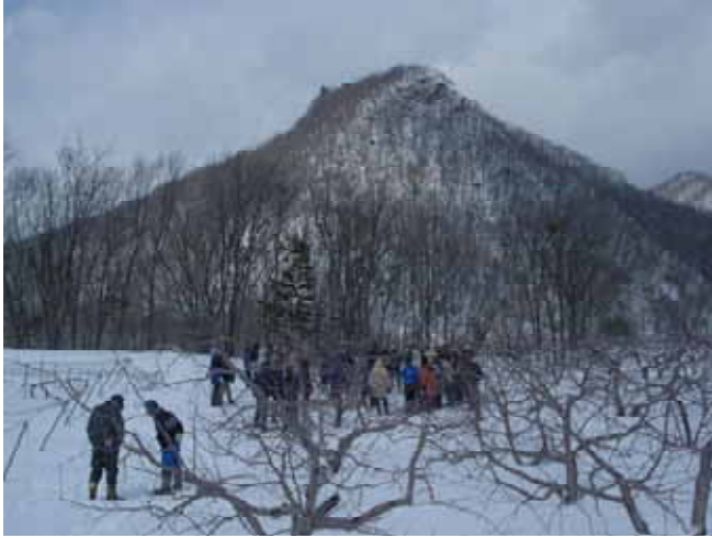
【 八剣山と雪に埋もれる果樹園 】