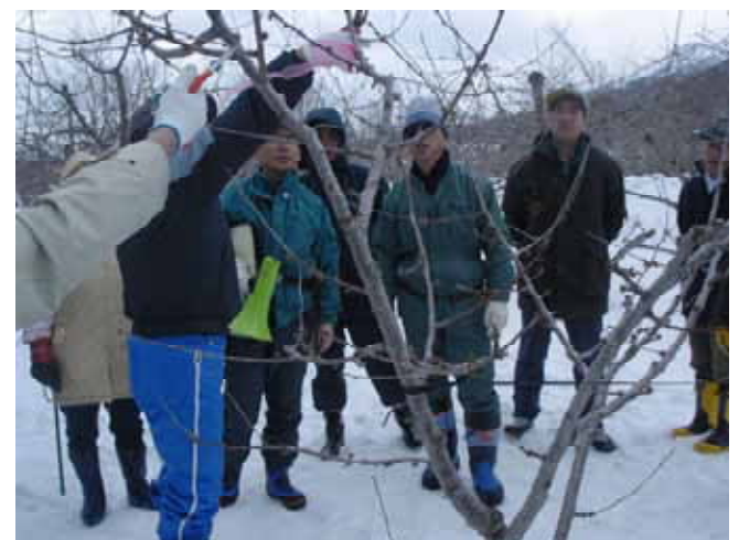
【 参加者によるサクランボの木の剪定 】