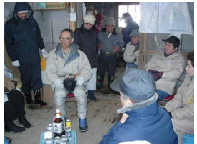
【 果樹栽培についての質疑応答 】