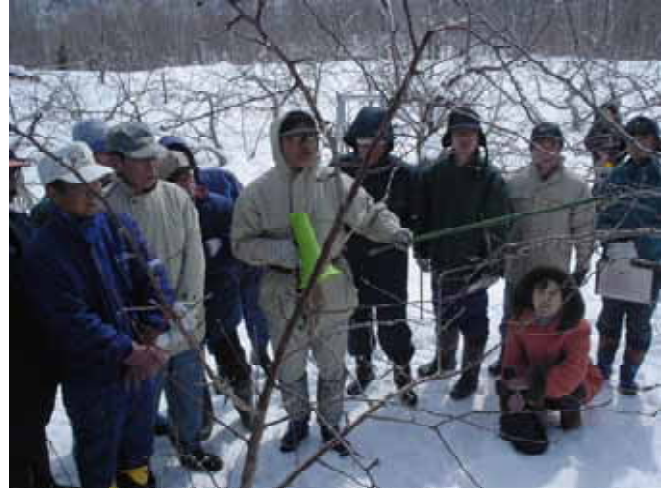
【 リンゴの木による剪定方法の説明 】