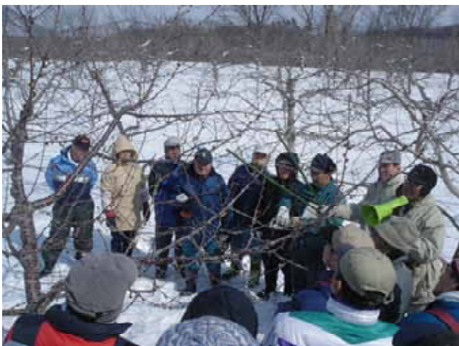
【 サクランボの木による剪定方法の説明 】