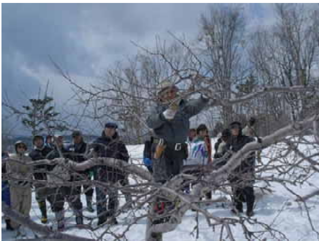
【 参加者によるリンゴの木の剪定 】