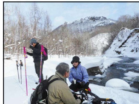
中間地点でのコーヒータ임