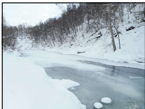
下流部分が凍りついた豊平川の流れ