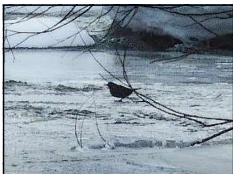
流れの中でエサを探すカワガラス