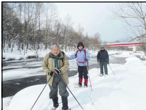
砥山栄橋から豊平川に沿って下流へ