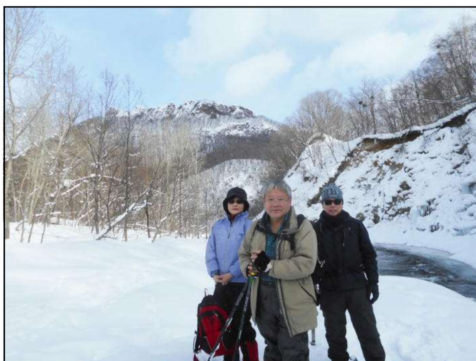
八剣山と豊平川の流れをバックに記念撮影