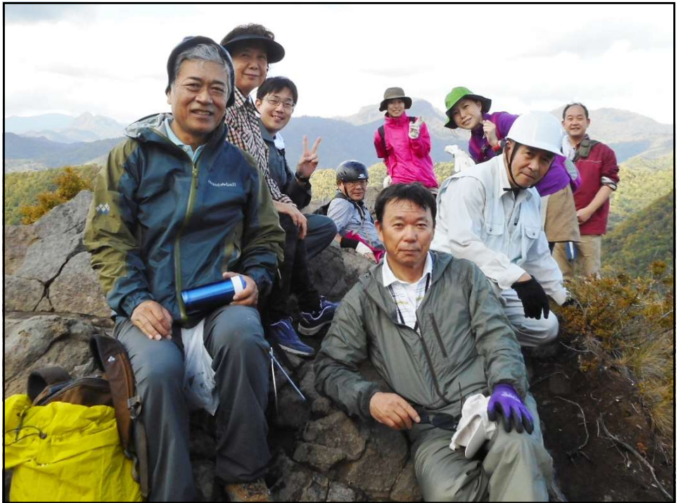
八剣山山頂に到着、しばしの休憩と絶景をバックに記念撮影