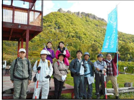
八剣山をバックに、いざ出発