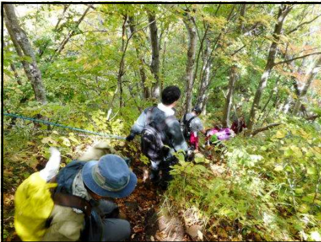
ロープを掴んでゆっくり下山