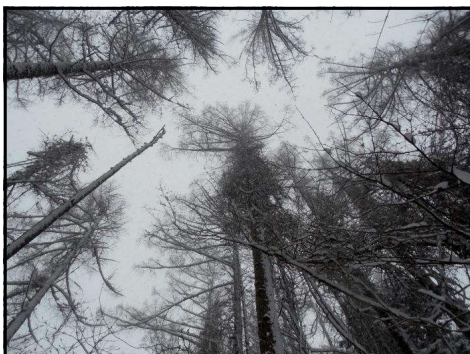
林の中から上空を見上げて