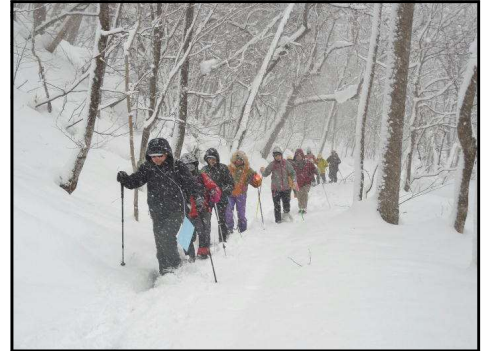
一列に並んで歩く参加者