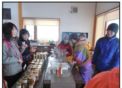
ワイナリーの試飲コーナーで休憩