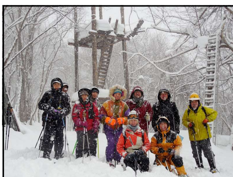
建造物をバックに記念撮影