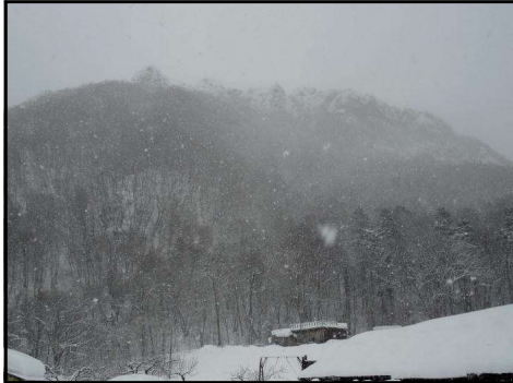
山頂が霞んでいる八剣山