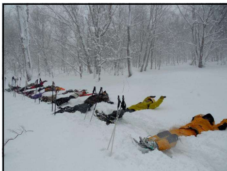
雪原で倒れ込み空を見上げる