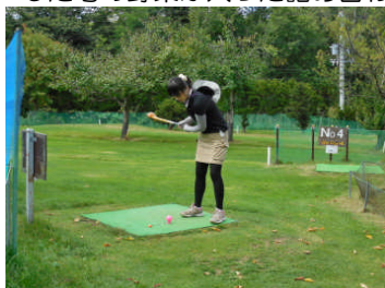
プレーをする参加者