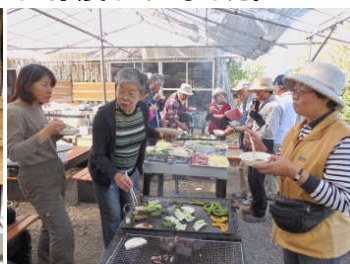
交流会で生産野菜も試食