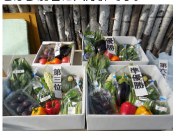
用意された賞品の数々