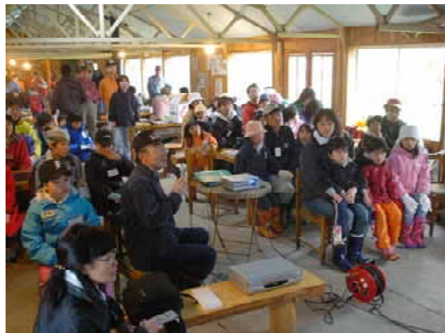
【 リンゴの収穫までの作業について説明 】