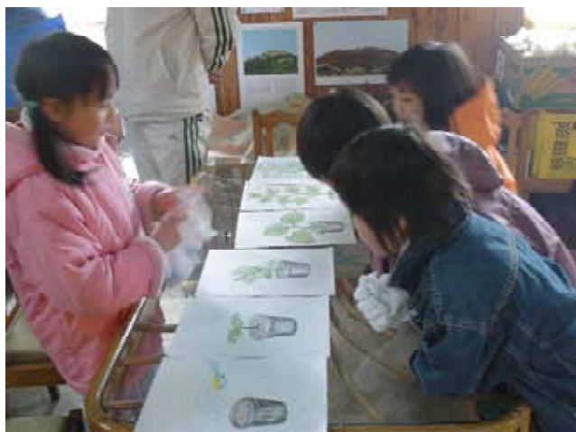
【 カードの並べ替えの打ち合わせ 】