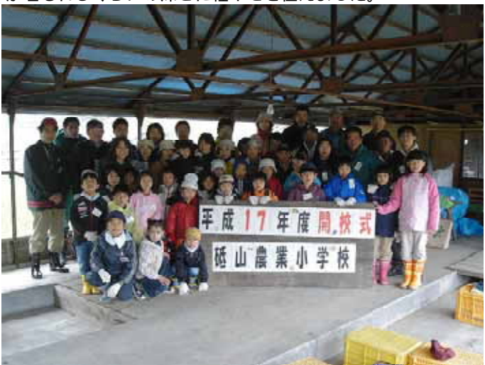
【入学式の記念撮影】

ジャガイモ植え付け作業では、はじめに男爵と北あかりの2種類の種イモを、子供たちは慎重に包丁で切り分けていました。八剣山果樹園で用意してくれた、うね状に土を盛り上げた畑のマルチに空き缶を半分に切った器具で穴を開け、指が埋もれるくらいの深さに種イモを植えました。