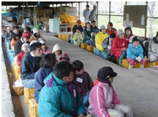
【 入学式で説明を聞く参加者 】