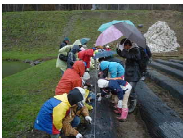
【 種イモの植え付け作業 】