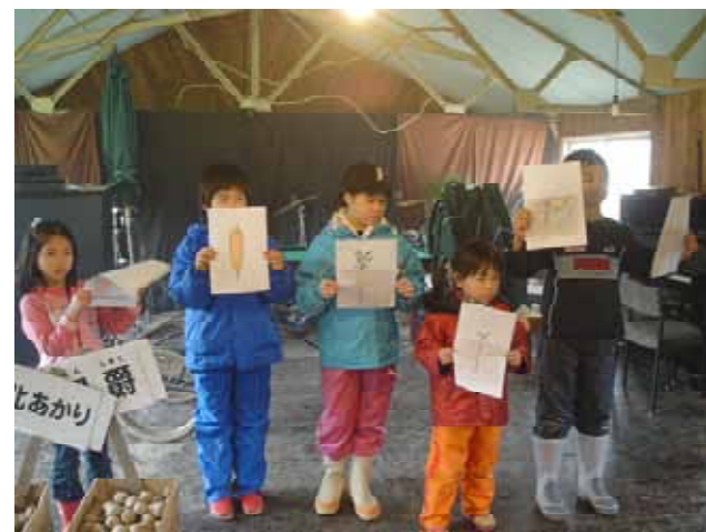
【 野菜の成長順についての発表 】