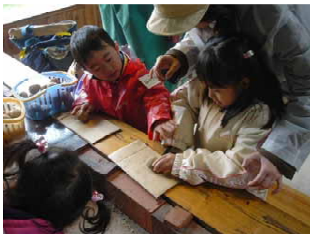
【 種イモの切り分け作業 】